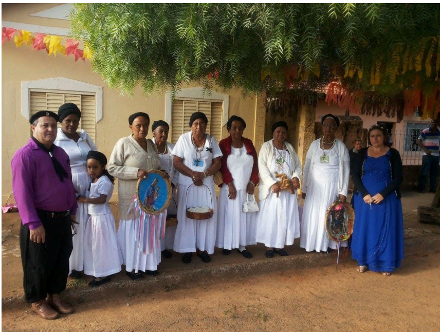
Reis, rainhas, escravas e festeiros.