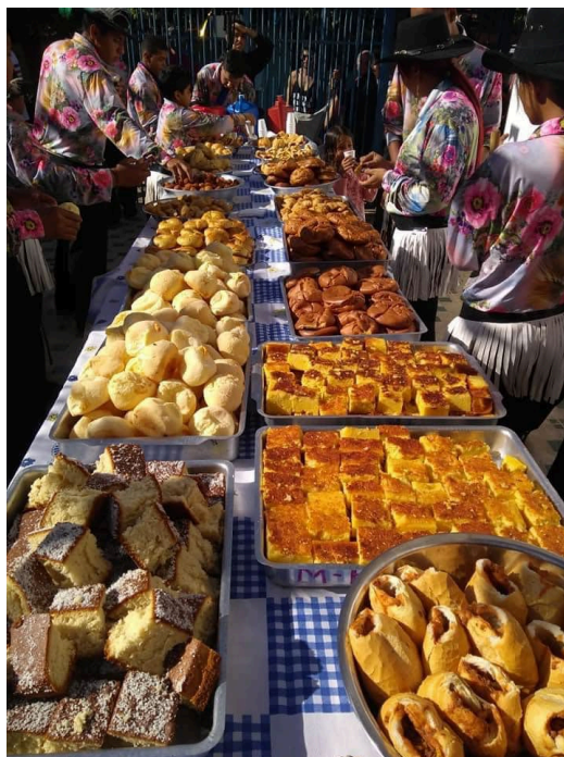
Quitandas servidas aos participantes da Festa de Nossa Senhora do Rosário.