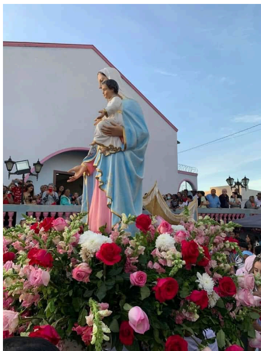
Procissão da Festa de Nossa Senhora do Rosário.