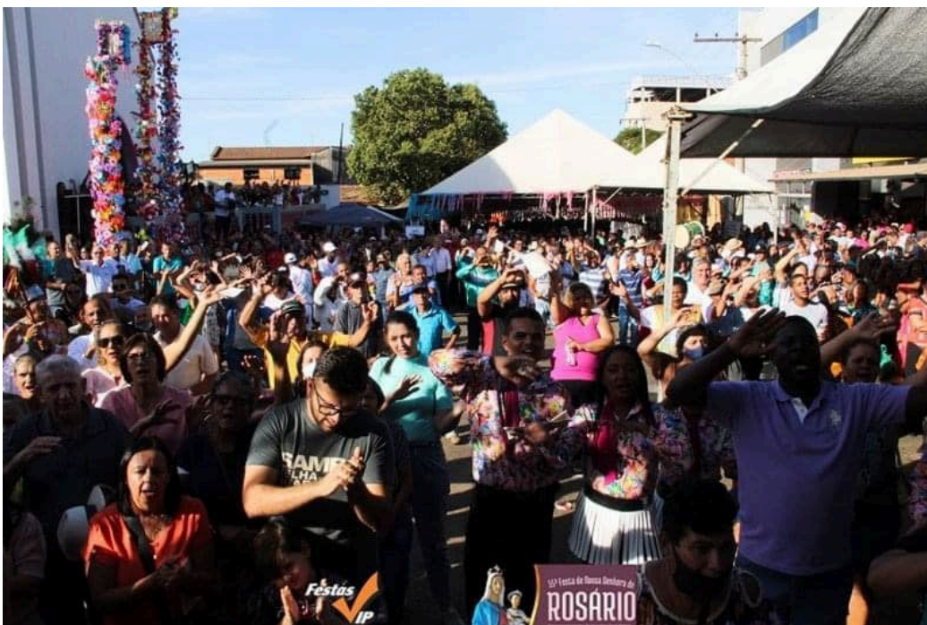
Festa de Nossa Senhora do Rosário.