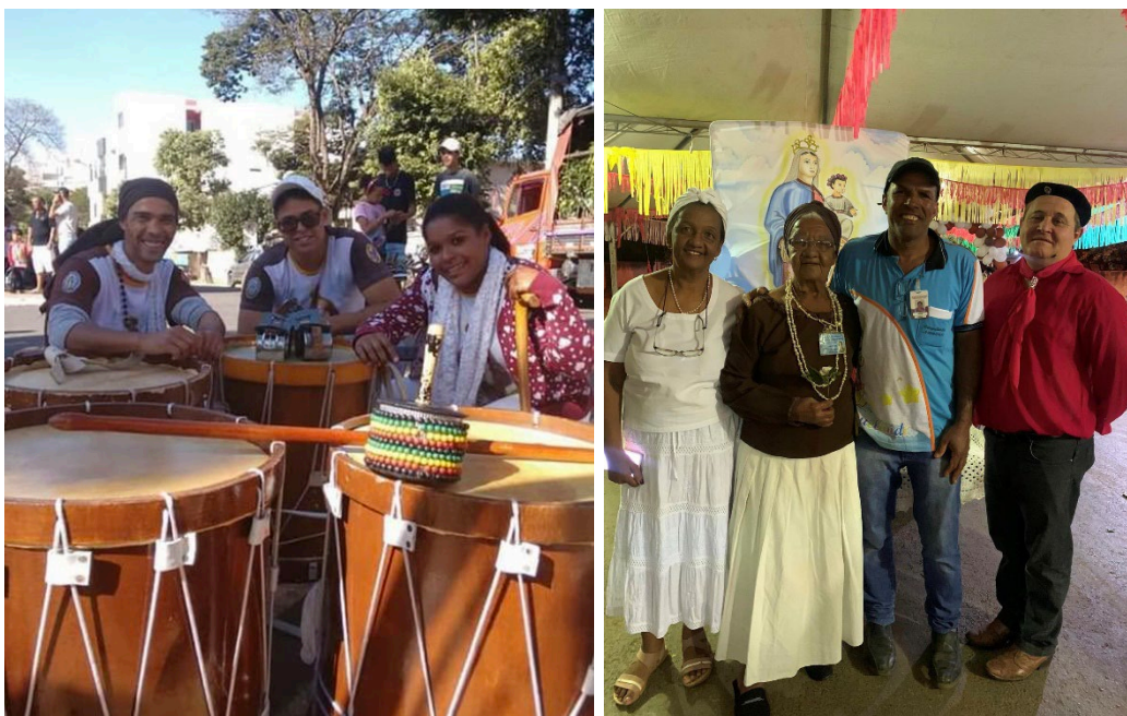
Participantes da Festa de Nossa Senhora do Rosário.