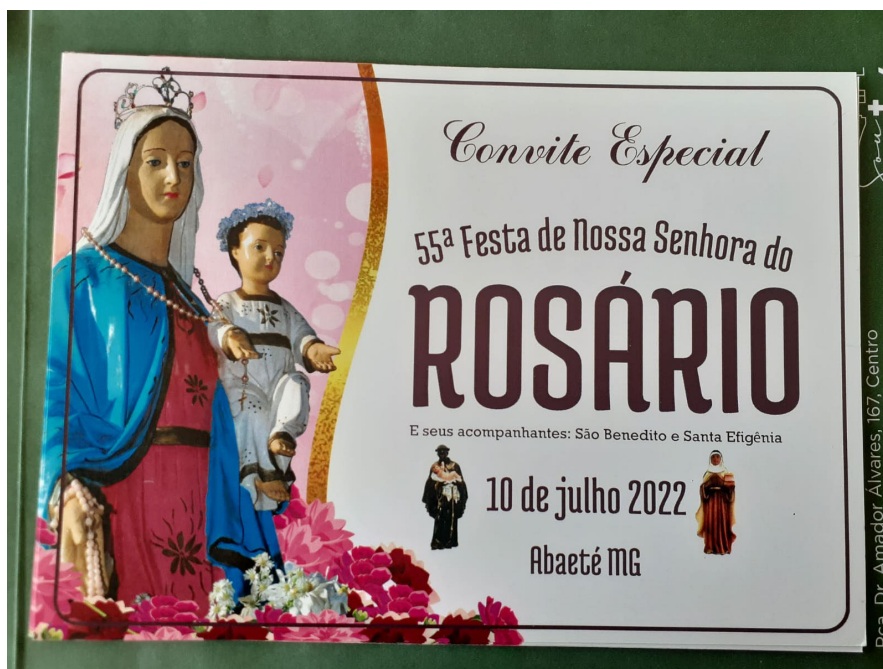
Convite da festa.

A parte social (barraquinhas e shows) foi retomada, bem como a integridade da parte religiosa.