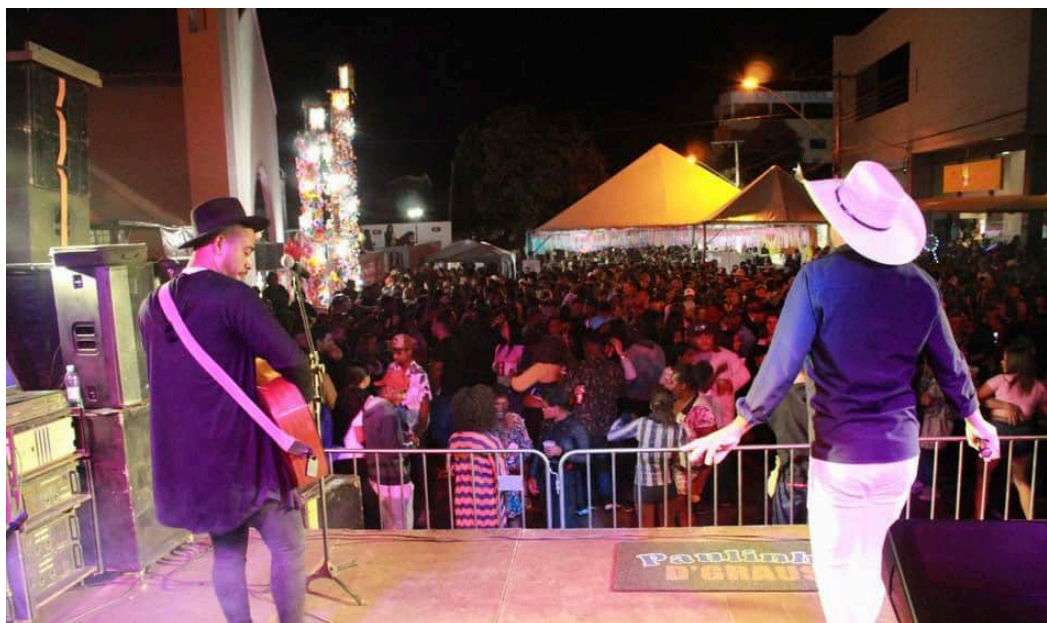
Parte social da Festa de Nossa Senhora do Rosário.