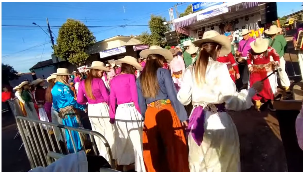
#SalveMaria #Congado #festadorosario festa do Rosário ABAETÉ MG 2022