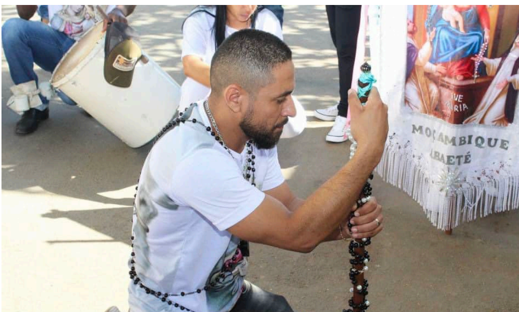
Terno Moçambique na Festa de Nossa Senhora do Rosário.