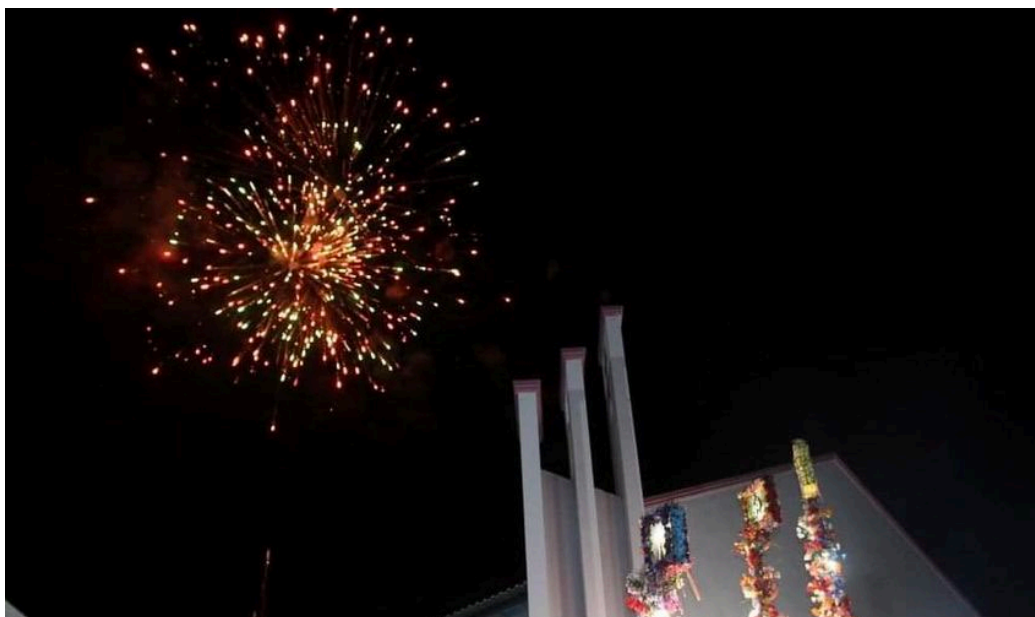
Queima de fogos da Festa de Nossa Senhora do Rosário.