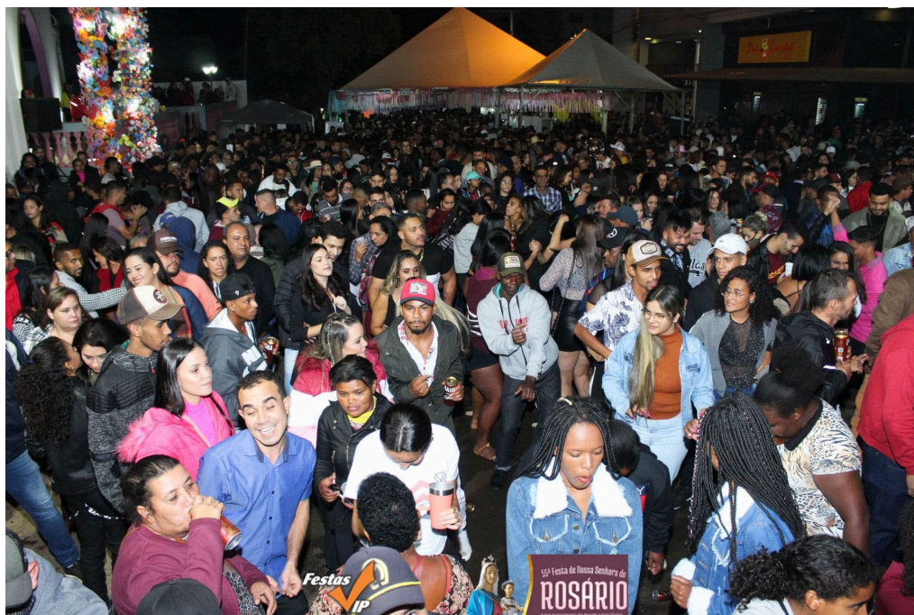
Parte social da Festa de Nossa Senhora do Rosário.