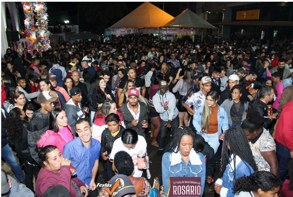
Parte social da Festa de Nossa Senhora do Rosário.