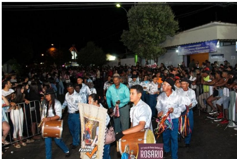
Parte social da Festa de Nossa Senhora do Rosário.